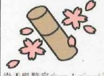
岩手県警察ホームページ