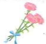
岩手県警察ホームページ

発 行 所 稲 瀬 駐 在 所 Tel. 35-2644 協 力 稲 瀬 地 区 セ ン タ ー 稲 瀬 派 員 会 生 活 安 全 部