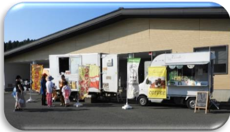
キッチンカーさん