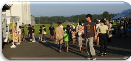
にぎわってる様子