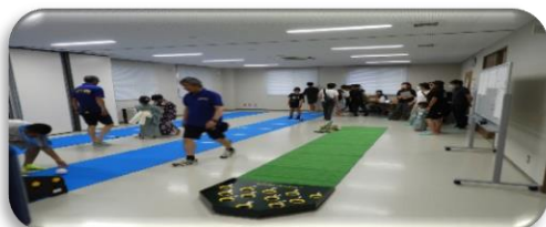
ニュースポーツ大会の様子