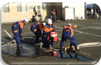
「消防団第 20 分団」実演