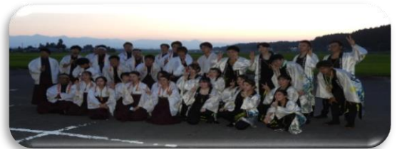
25 歳、42 歳年祝連さん