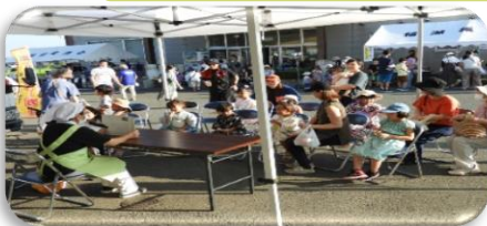
食改善さんによる読み聞かせにぎわってる様子