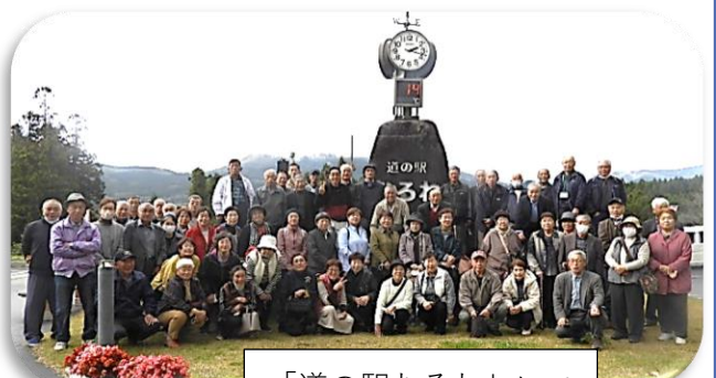
「道の駅むろね」にて